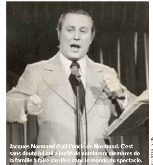
Jacques Normand était l'oncle de Normand. C'est sans doute lui qui a incité de nombreux membres de la famille à faire carrière dans le monde du spectacle.

Marius et Fanny sera présentée au Théâtre du Rideau Vert en janvier 2013. Retrouvez l'intégralité de cette entrevue en vidéo dans les bonus web de la capsule Chouinard, sur le site lequebecunehistoiredefamille.com .