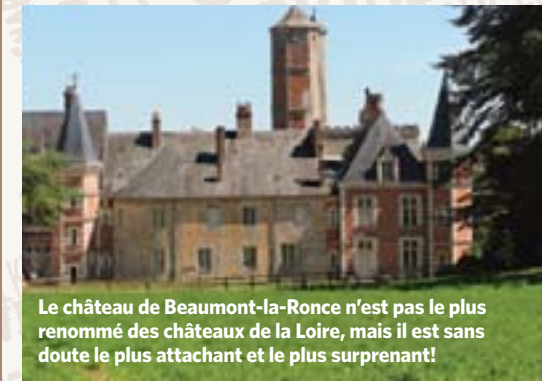
Le château de Beaumont-la-Ronce n'est pas le plus renommé des châteaux de la Loire, mais il est sans doute le plus attachant et le plus surprenant!