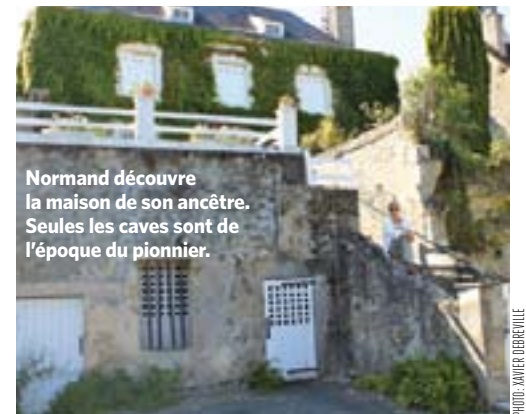
Normand découvre la maison de son ancêtre. Seules les caves sont de l'époque du pionnier.